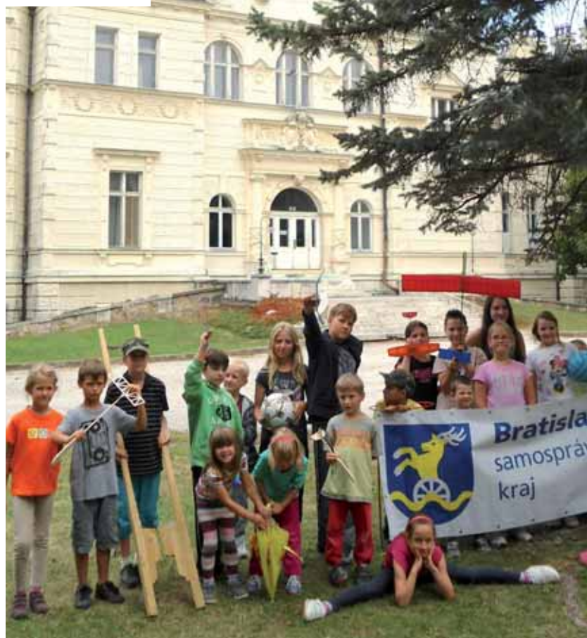
Najmladší športovci z letného tábora