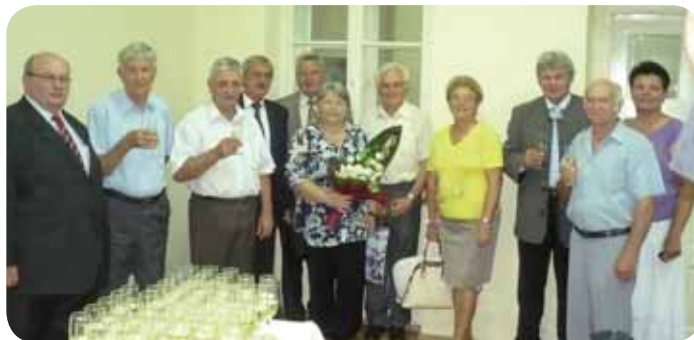
V tomto roku v auguste v Nadlaku sa stretli zakladatelia našej cezhraničnej spolupráce – prvej dohody zo Slovenska.